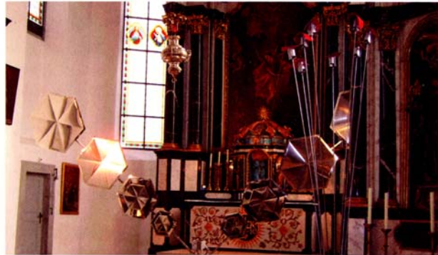
Die selbstgebauten Metallinstrumente des Klangkünstlers Christof Schläger wirkten in der barocken Kapelle des Klostersgutes besonders interessant

Am Abend des ersten Tages wurde bei einer Exkursion die Schöttli AG in Diessenhofen besucht, die Heißkanalsysteme, Spritzgießwerkzeuge und Werkzeuge für die Kunststoffbearbeitung herstellt. Zum Abschluss der Tagung brachte der Klangkünstler Christof Schläger in der