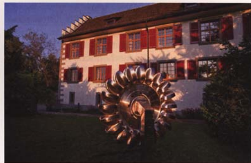
Die Eisenbibliothek in Schaffhausen war Tagungsort der Technikgeschichtlichen Tagung